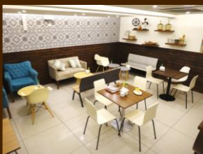
Salón temático Teatinos